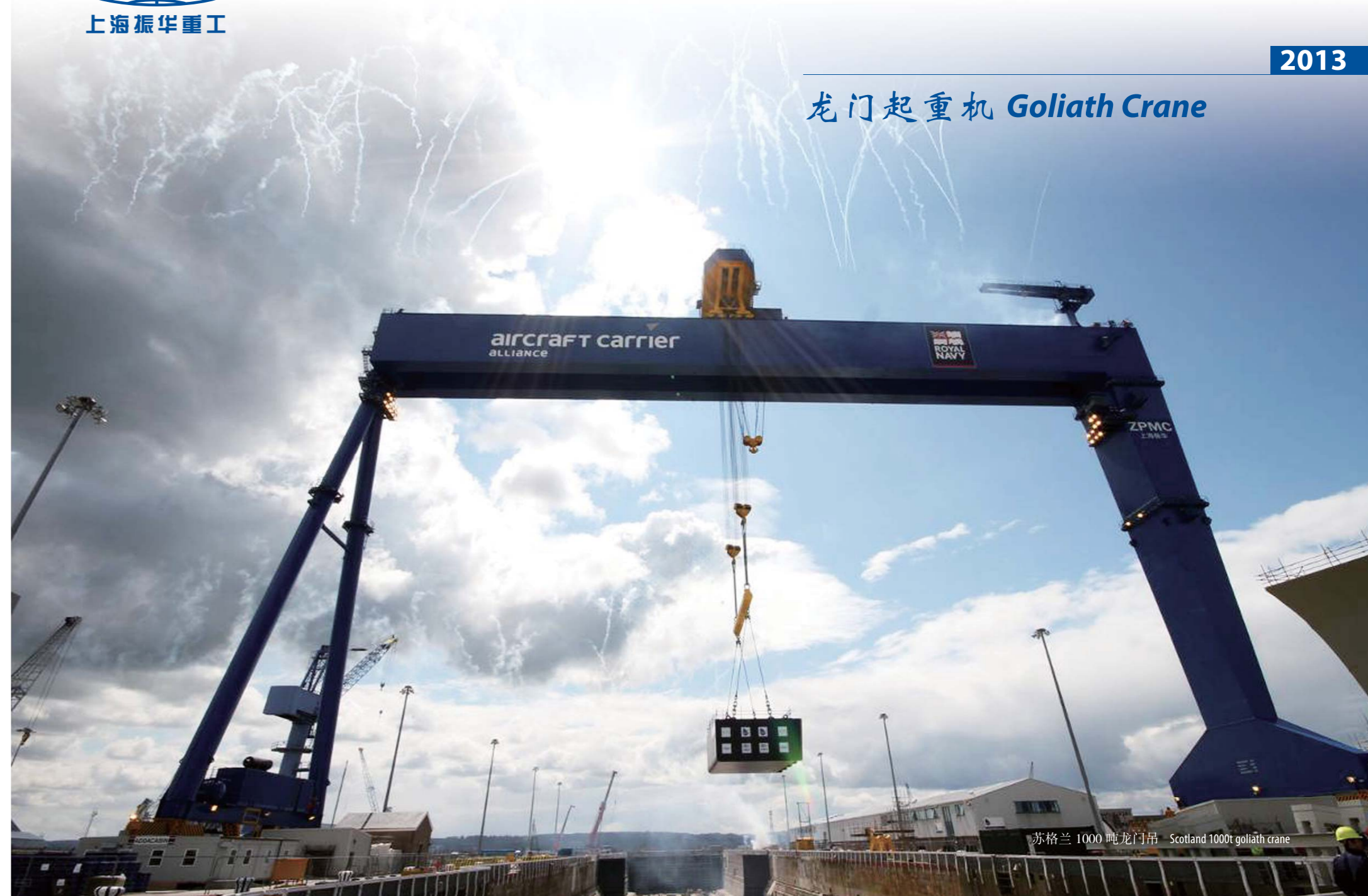
苏格兰 1000 吨龙门吊 Scotland 1000t goliath crane