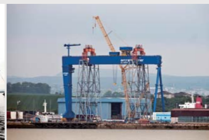
英国爱丁堡 1000x118.87m 龙门起重机 Babcock Marine (Rosyth) Ltd 1000t x 118.87m Goliath Crane