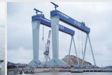
日本常石 700x130m 龙门起重机 Tsuneishi Shipbuilding 700t x 130m Goliath Crane