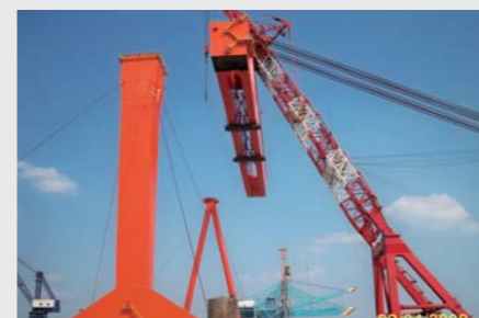
5. 浮吊大件吊装 5. Erection by floating crane