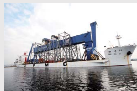
3. 船上塔架提升整机滑移上岸 3. Erection on ship by tower frame and transport fully-erected goliath unto shore