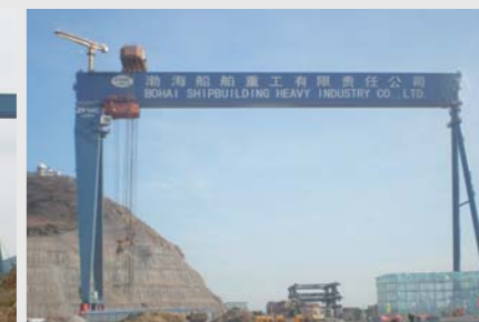
渤海 1000x140m 龙门起重机 Bohai Shipbuilding Heavy Industry Co., Ltd 1000t x 140m Goliath Crane