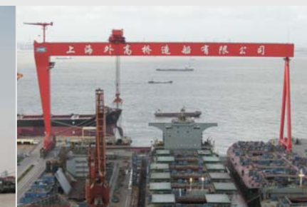
外高桥 600x185m 龙门起重机 Waigaoqiao Shipbuilding Shanghai, China 600t x 185m Goliath Crane