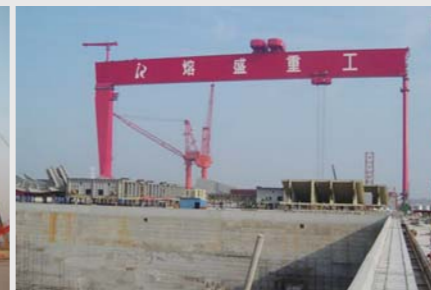
熔盛重工 1600x202m 龙门起重机 Rongsheng Heavy Industries Group Co.,Ltd 1600t x 202m Goliath Crane