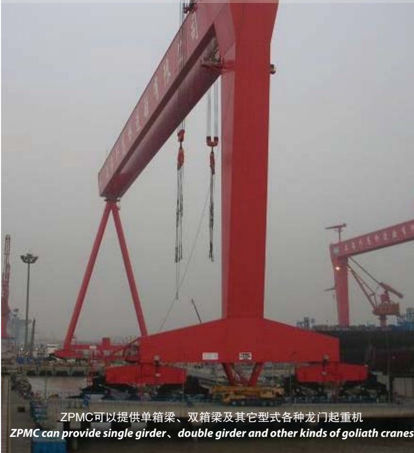
ZPMC可以提供单箱梁、双箱梁及其它型式各种龙门起重机 ZPMC can provide single girder、double girder and other kinds of goliath cranes

Goliath crane is composed by girder、pier leg、shear leg、gantry travel、upper trolley、lower trolley and service crane, which is mainly used to install ship block, and it is one of the most important equipment in shipyard.