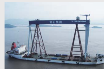
6. 浮吊船上总装整机发运方案 6. Erection on ship and fully-erected transporting