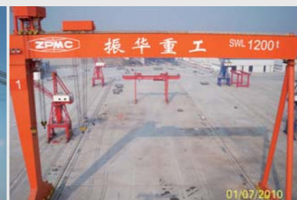
振华重工 1200x120m 龙门起重机 ZPMC 1200t x 120m Goliath Crane