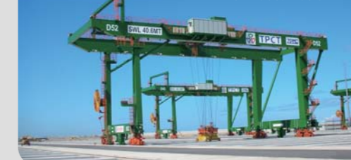
RMG, произведенный компанией ZPMC для TPCT, порт Тайбэй RMG made by ZPMC for TPCT, Taipei Port