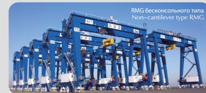
RMG, произведенные компанией ZPMC для порта Тяньцзинь RMG made by ZPMC for Tianjing Port