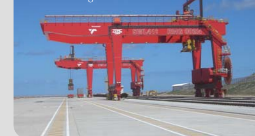
RMG, поставленные компанией ZPMC для порта Ngqura, Южная Африка RMG made by ZPMC for Ngqura Port, S. Africa