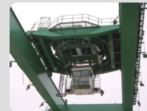
RMG с поворотной тележкой RMG with Rotation trolley