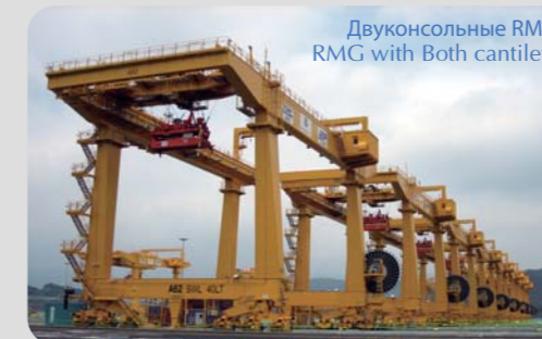
RMG, произведенные компанией ZPMC для терминала PNC, Южная Корея RMG made by ZPMC for PNC, KOREA