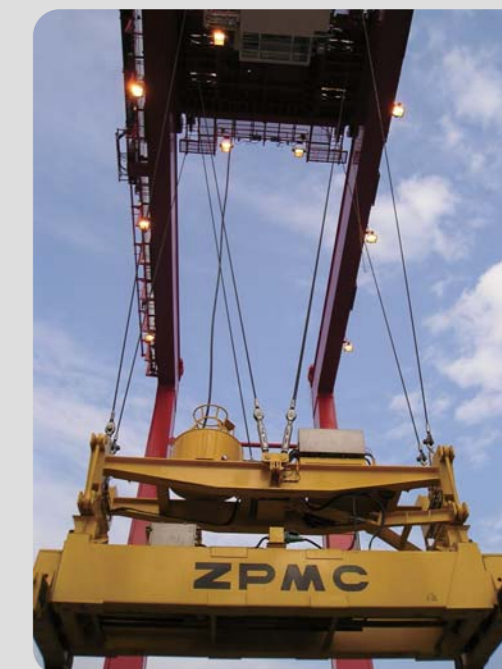
RMG с двунаправленной системой против раскачивания (8 канатов) RMG with Bidirectional (8 Ropes) Anti-sway system